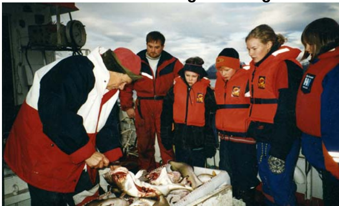
Aktive lokale samiske språkbrukere benyttes i undervisningen til Samisk språksenter.

Samisk språksenter tilbyr en rekke undervisningsopplegg til både ansatte og barn/ungdom i barnehager og i skoleverket. Språksenteret har også utviklet undervisningsmaterieell som er tilgjengelig for lærere via Internett.